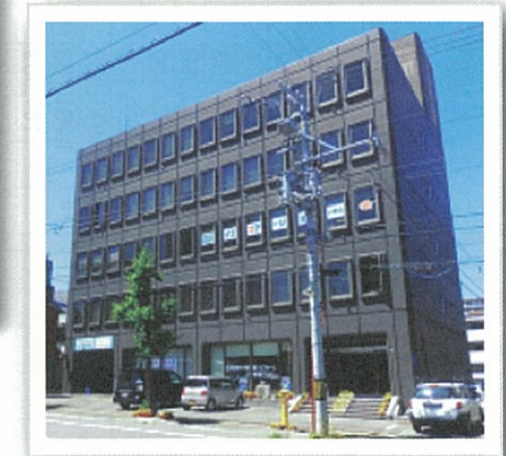
相談支援センター HIROBA