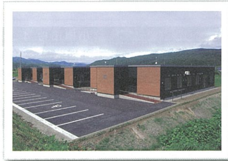
グループホームコタン